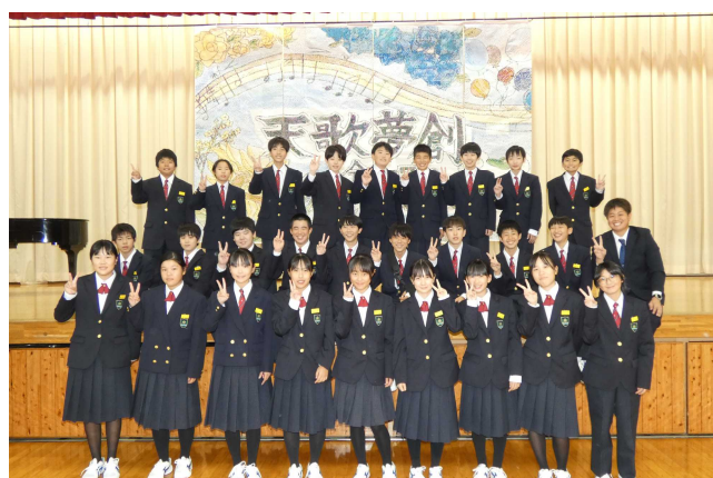
全校制作の前で。一人一人の作品が全体の一部になって素晴らしい作品が仕上がりました。